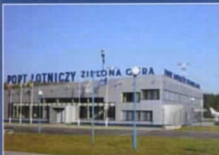
Port Lotniczy Zielona Góra – Babimost – kameralne lotnisko z dużymi możliwościami

odprawy. To tutaj nadamy bagaż oraz odbierzemy kartę pokładową. Odprawa odbywa się na pół godziny przed odlotem, dlatego ważne jest, abyśmy nie przyjeżdżali na lotnisko „na ostatnią chwilę”. Później pozostaje tylko kontrola bezpieczeństwa i niesamowite uczucie pierwszego lotu.