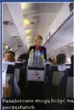
Pasażerowie mogą liczyć na poczęstunek