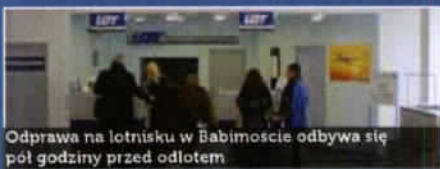
Odprawa na lotnisku w Babimostcie odbywa się pół godziny przed odlotem