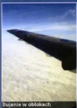
Bujanie w obłokach