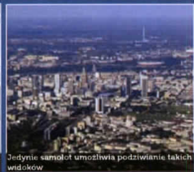
Jedynie samolot umożliwił podziwianie takich widoków