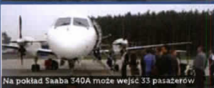
Na pokład Saaba 340A może wejść 33 pasażerów